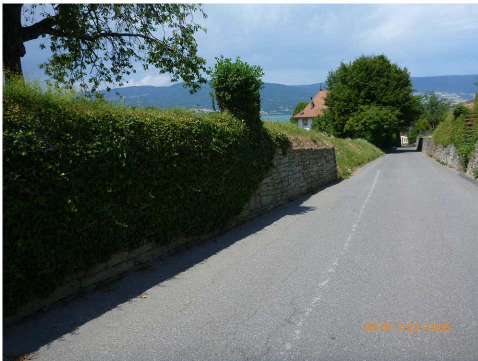
Photos de l'objet 22.07.2015